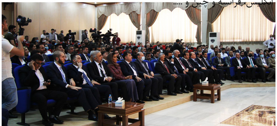
نشست تجاری ایران و کردستان عراق در حوزه ساخت و ساز - شهریور ۱۴۰۰