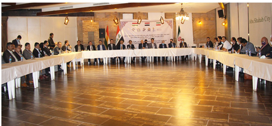
نشست تجاری ایران و کردستان عراق در حوزه ساخت و ساز - شهریور ۱۴۰۰